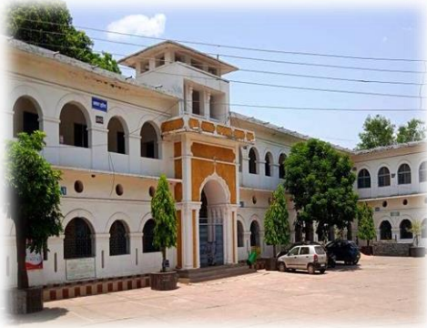
महाविद्यालय ब्लॉक A, एवं ब्लॉक B