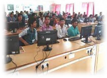
महाविद्यालय का कंप्यूटर कक्ष