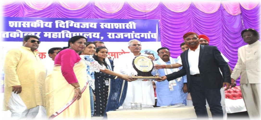
महविद्यालय के वार्षिक सम्मलेन में माननीय मुख्यमंत्री श्री भूपेश बघेल का सम्मान