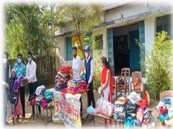
यूथ रेड क्रास द्वारा कम्बल वितरण