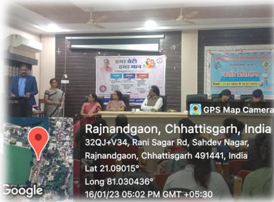
व्यक्तित्व विकास कार्यक्रम में अतिथि व्याख्यान