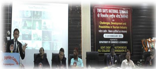
दो दिवसीय राष्ट्रीय संगोष्ठी में मुख्य अतिथि उद्बोधन