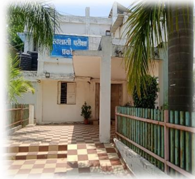
स्वशासी परीक्षा प्रकोष्ठ