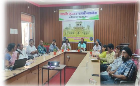
IQAC बाह्य समिति की बैठक का हुआ आयोजन