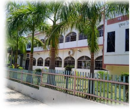
महाविद्यालय का पुस्तकालय