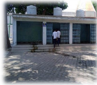
विद्यार्थियों हेतु पेयजल व्यवस्था