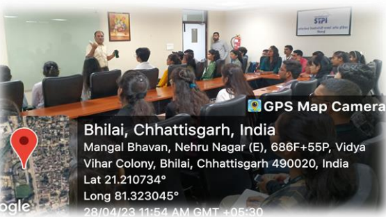
सॉफ्टवेयर टेक्नोलॉजी पार्क ऑफ इंडिया का भ्रमण