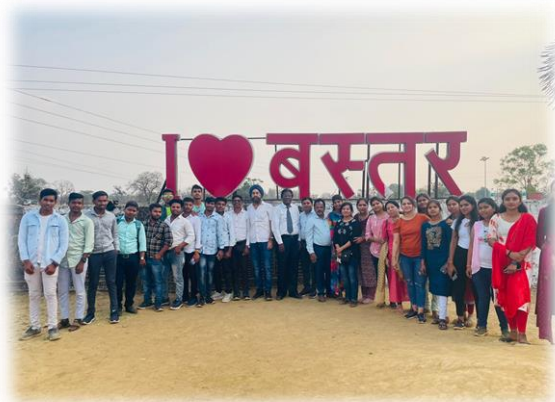
वाणिज्य विभाग का बस्तर शैक्षणिक भ्रमण