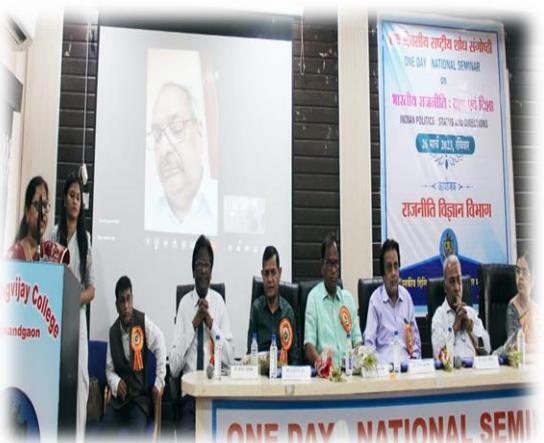
एक दिवसीय राष्ट्रीय संगोष्ठी में स्वागत उद्बोधन