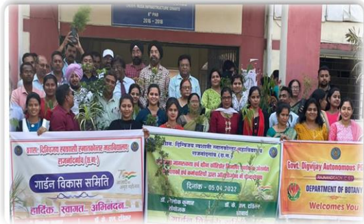
महाविद्यालय में पौधारोपण के कार्यक्रम गार्डन विकास समिति के मार्गदर्शन में