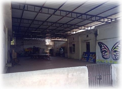
महाविद्यालय की कैंटीन