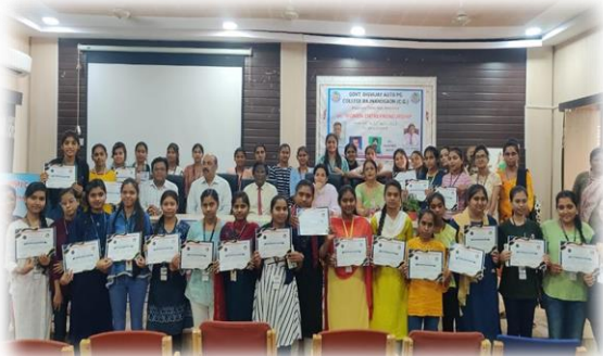
छात्राओं को सशक्त बनाने, महिला उद्यमिता पर तीन दिवसीय कार्यशाला