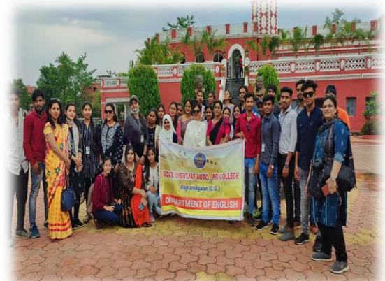
अंग्रेजी विभाग का इंदिरा कल एवं संगीत वि.वि. का भ्रमण