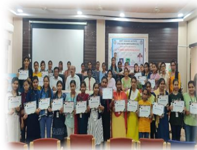
महाविद्यालय का न्यू हॉल