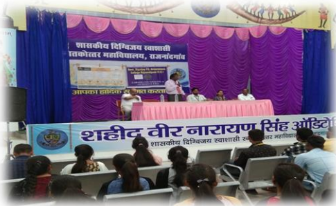
महाविद्यालय का शहीद वीर नारायण सिंह ऑडिटोरियम