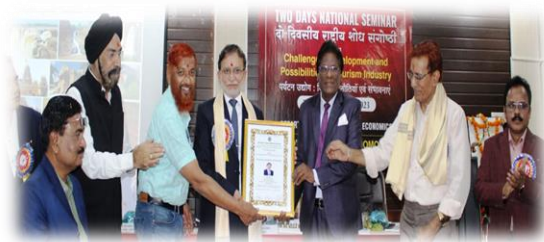
दो दिवसीय राष्ट्रीय संगोष्ठी में मुख्य अतिथि का सम्मान