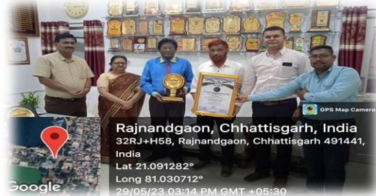
दिग्विजय महाविद्यालय को मिला क्रान्तिज्योति सावित्रीबाई फूले समता नेशनल अवार्ड