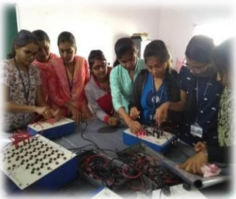
भौतिक शास्त्र लैब