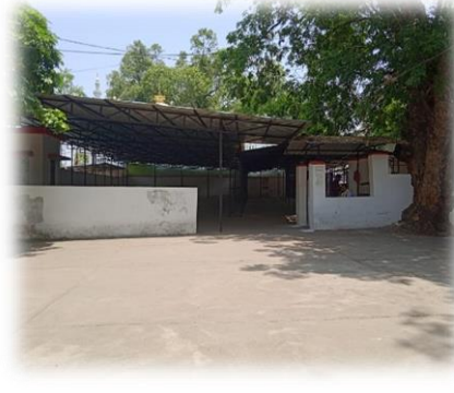
महाविद्यालय का साइकल स्टैंड