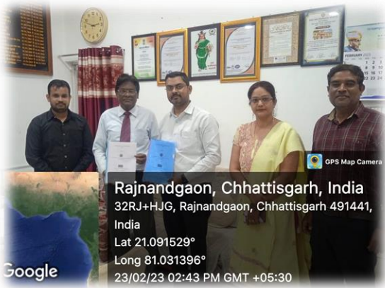
MoU की झलकियाँ