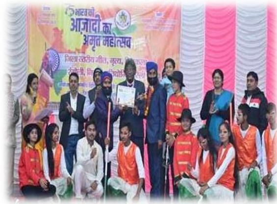
आजादी का अमृत महोत्सव