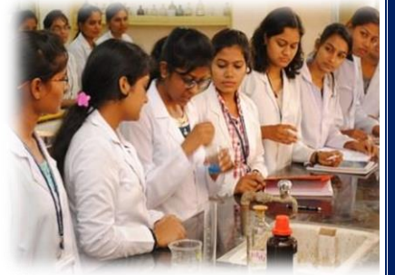
रसायन शास्त्र प्रयोगशाला कक्ष