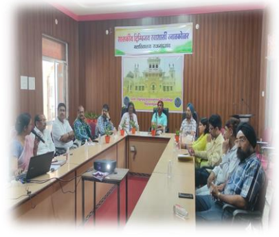
महाविद्यालय का कांफ्रेंस हॉल