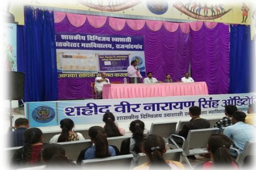
महिद्रा फाइनेंस द्वारा आयोजित प्लेसमेंट कैंप