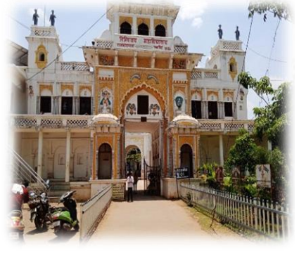
महाविद्यालय प्रवेश द्वार