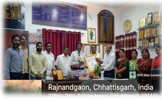
प्राचार्य महोदय/महाविद्यालय को प्राप्त अंतर्राष्ट्रीय सम्मान